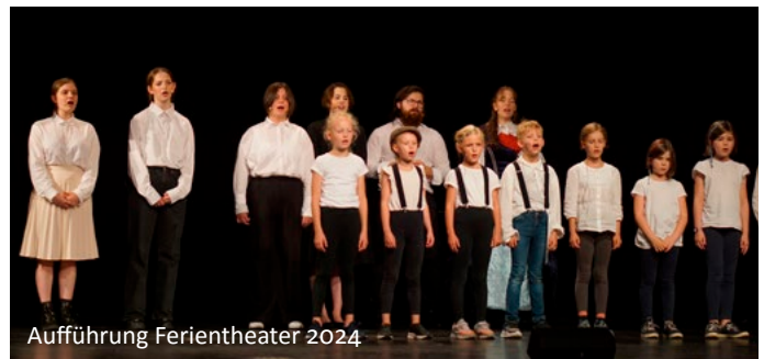
Aufführung Ferientheater 2024

Freitag 15. August | 19 Uhr Abteikirche Marienmünster