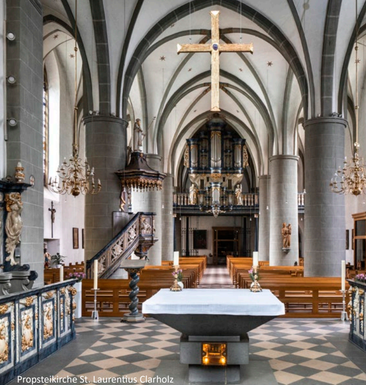
Propsteikirche St. Laurentius Clarholz