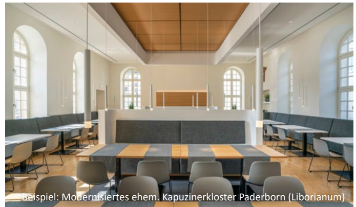
Beispiel: Modernisiertes ehem. Kapuzinerkloster Paderborn (Liborianum)