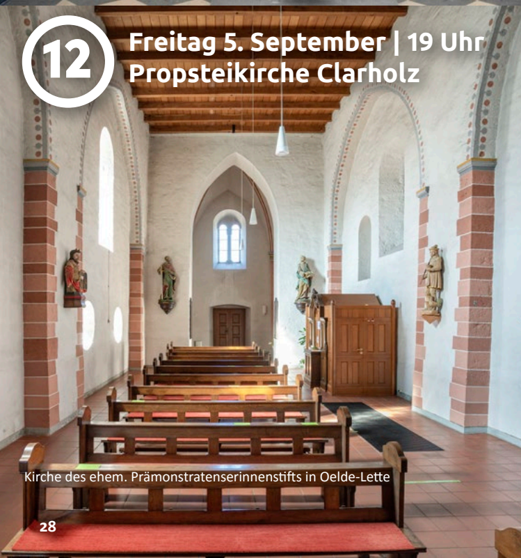
Kirche des ehem. Prämonstratenserinnenstifts in Oelde-Lette

Freitag 5. September | 19 Uhr Propsteikirche Clarholz