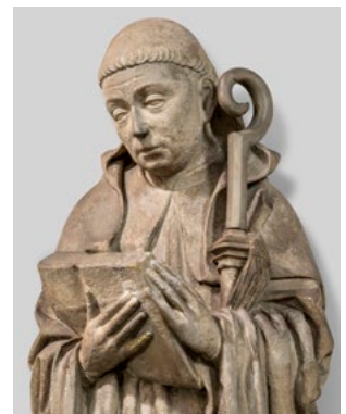
Skulptur des hl. Norbert in St. Laurentius, Clarholz

Propsteikirche St. Laurentius Propsteihof 24 · 33442 Herzebrock-Clarholz