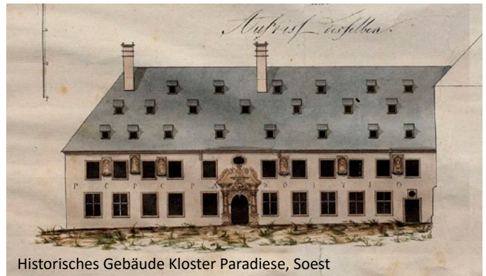
Historisches Gebäude Kloster Paradiese, Soest