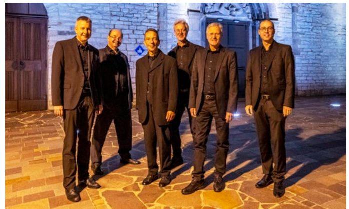
Vokalensemble ColVoc Detmold · Leipzig

Stiftskirche Freckenhorst Stiftshof 2 · 48231 Warendorf-Freckenhorst