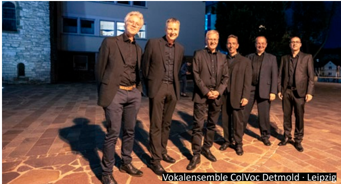
Vokalensemble ColVoc Detmold - Leipzig

multimedialen Erschließung und Konservierung des karolingischen Westwerks.